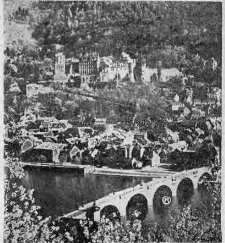
Vista sobre la ciudad vieja de Heidelberg a orillas del Neckar, la ciudad universitaria más antigua del territorio de habla alemana.

HEILDELBERG (Por Angelika Dick — Impresiones de ALEMANIA)