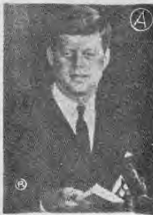
PRESIDENTE KENNEDY...firmará la "Resolución Conjunta"...

El Ministro agregó que mientras en otros países latinoamericanos los estudiantes luchaban contra sus gobiernos despoticos, en Cuba los estudiantes colaboran con la revolución y trabajan "voluntariamente" en las campos, ayudando a los campesinos.