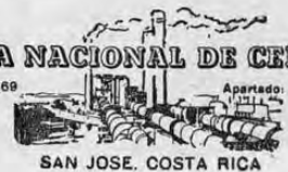
SAN JOSE, COSTA RICA