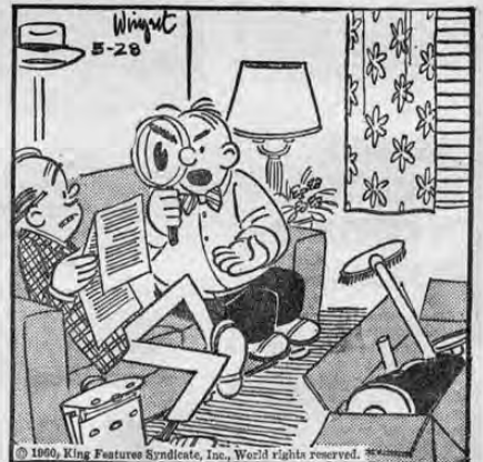
—Antes de firmar, permítame usted que lea esas cláusulas de letra pequeñita que hay en el contrato.