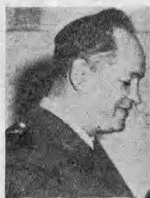
GUSTAVO ROJAS PINILLA...sus abogados dicen que es una infamia...

BOGOTÁ, 19. AP.— El ex-dictador Gustavo Rojas Pinilla comparecerá el jueves ante la Corte Suprema de veinte magistrados que lo juzgará por la acusación que se le hace de tentativa de concusión cuando desempeñó el cargo de presidente de Colombia.